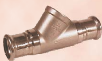
Прессфитинг „Mannesmann Pressfitting-System“