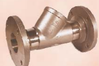
Фланцевое соединение без проточки "Cavity-free flanged connection"