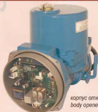
корпус открыт body opened

Изделия из нашего наименования / further products from our product range.