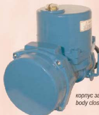
корпус закрыт body closed

Electric actuator Art. NE with positioner 4 ... 20mA