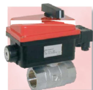
Корпус алюминиевый alu-body