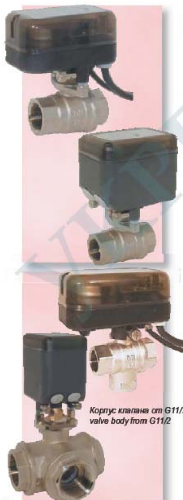
Корпус клапана от G11/2 valve body from G11/2

Design : 2-way or 3-way ball valve with electric actuator. Maintenance-free, full bore. Media : Steam, Neutral gases, liquids, viscous media Pressure range : From coarse vacuum to nominal pressure. For higher temperatures please refer to the Pressure-Temperature-Diagram Pressure range : PN 6 (87 psi) Temperature range : max. +120°C Body : Brass nickel-plated Ball : Brass chrome-plated Ball seals : PTFE Stem seals : FKM Voltage : 230V 50Hz Protection : IP 55 (CO116000 = IP54) Position indicator : standard Order example : e.g.: Art. CO111025-CO111200 Brass ball valve Art. CO, 1", with actuator Art. CO112000, 230V 50Hz, operating time = 15 sec.